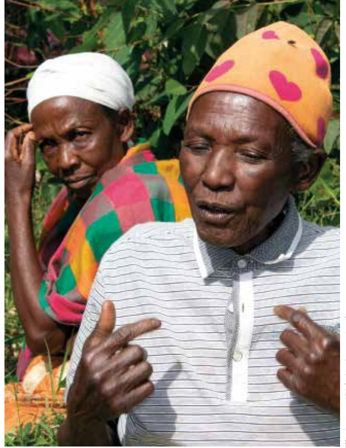
Elie Parravani/HelpAge International