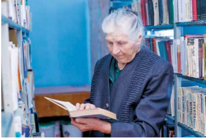
HelpAge International Moldova

• يجب أن يكون كبار السن قادرين على ممارسة حقوقهم العمالية والنقابية على قدم المساواة مع الآخرين.